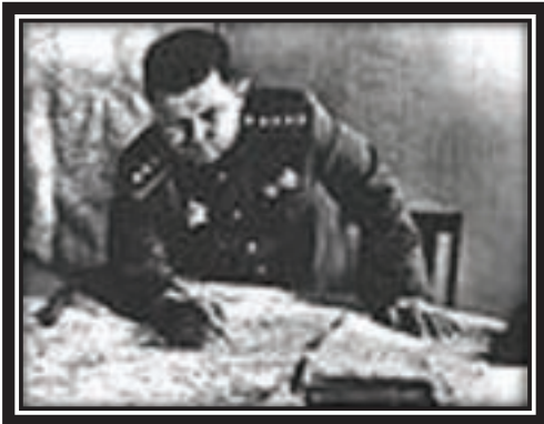
January, 1944. Commander of the 1 st Ukrainian Front, General Valutin developing plan of future advance

and ANVIL) would receive the highest US and British priority. Stalin confirmed Russia's intention to fight against Japan once Germany surrounded.