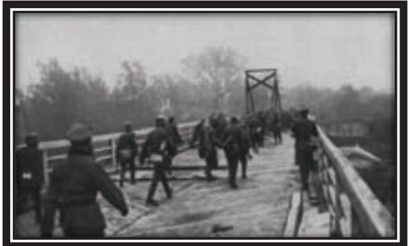
June 22, 1941. German troops crossing the bordering river

The Soviet Embassy in London teletype to Moscow: “As of now Cripps (the British Ambassador to Moscow who had returned to London) is deeply convinced of the inevitability of