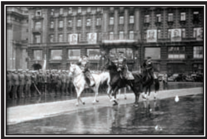
24 июня 1945г. Маршал Советского Союза Жуков Г.К. приветствует войска, принимающие участие в Параде Победы