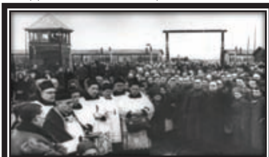
1944 г. Польша. Поминальное богослужение по погибшим узникам концлагеря Освенцим (Аушвиц)

Преследуя противника, Советская Армия пересекла границы СССР и вступила на территорию сопредельных государств: Польши (июнь 1944 г.), Румынии (август 1944 г.), Болгарии (сентябрь 1944 г.), Югославии и Норвегии (октябрь 1944 г.). В освободительном походе участвовали и иностранные военные формирования общей численностью в 550 тыс. человек, созданные с помощью СССР и находившиеся в