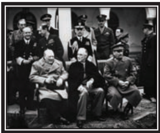
Февраль 1943г. Конференция руководителей трех союзных держав СССР, США и Великобритании в Крыму. Сталин И.В., Рузвельт. В., Черчилль У. среди военных экспертов

сударства. В свою очередь, уступая настойчивым просьбам Рузвельта и Черчилля, советский