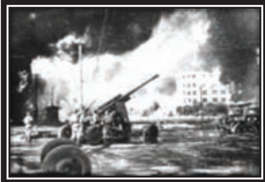
1942. Stalingrad on fire. Anti-craft artillery opens fire on German planes

Hitler stated he was still intended to take over Stalingrad despite the staggering losses. He said