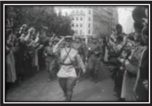
October 30, 1944. Soviet Army troops on the streets of Belgrade

Poland but interests were established, with Britain to have 100 percent interest in Greece, Russians and Britain to have 50 percent interest each in Yugoslavia, and the Russians to gain 75-80 percent interest in Bulgaria, Rumania and Hungary.