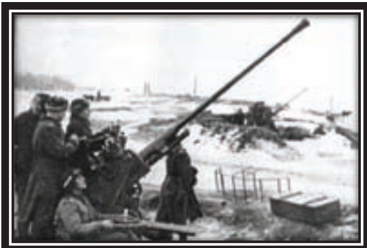
1943. The defenders of the Ladoga military fleet on the "road of life"

The Russian 40 th and 3 rd Tank Armies reoccu-