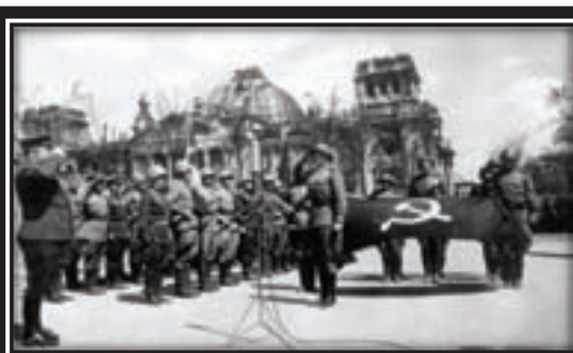
20 мая 1945 г. Берлин. Торжественная церемония передачи Знамени Победы военному коменданту Берлина Герою Советского Союза генерал-полковнику Барзарину Н.Э. для отправки в Москву

Одним из главных итогов войны стала новая геополитическая ситуация. Она характеризовалась нарастающим противостоянием ведущих капиталистических держав и Советского Союза, распространившего