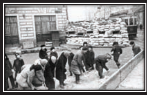
1941. Muscovites building barricades on the outskirts of the city

Smolensk fell to the Germans, about 600,000 Russians were captured. It was a military disaster, but Soviet resistance now began to stiffen for the