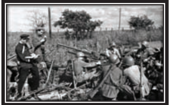
1941. Troops defending Odessa next to seized enemy weapons

General Keitel responded to growing Russian partisan warfare by ordering the execution of as many as 100 hostages for every German soldier killed by the guerillas.