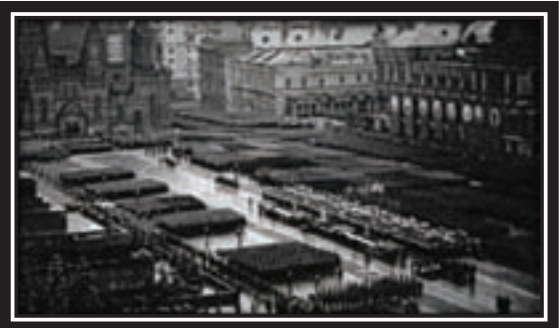
June 24, 1945. Victory Parade on the Red Square

German representative arrived at Supreme Headquarters, Allied Expeditionary Force (SHAEF)