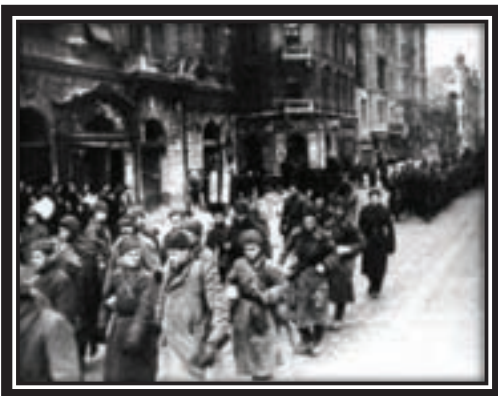
Январь 1945г Венгрия. Бойцы Красной Армии проходят по одной из улиц Будапешта

О последнем следует сказать особо. Вооруженное выступление в польской столице началось в августе