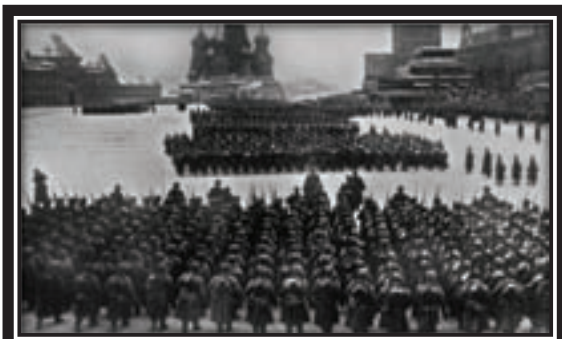
7 ноября 1941г. Во время военного парада на Красной площади, посвященного 24-й годовщине Великой Октябрьской социалистической революции

пленными 5 млн. человек, большую часть танков и самолетов. И все же главной своей цели в летне-осенней кампании гитлеровское командование не добилось. В начале декабря оно было