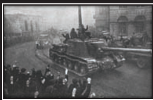
1945. Poland. Lodz residents welcome Soviet tankers entering the city

Eisenhower confirmed plans for the final campaign to knock Germany out of war by choosing Leipzig instead of Berlin as the ultimate objective. Russians were to occupy the German capital. The