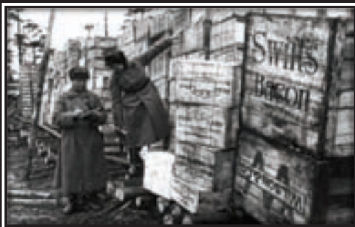
8 апреля 1943 г. Ленинградский фронт. Американское продовольствие на одном из складов

Прошлое с его преступлениями, безумством и трагедиями исчезает. Я вижу русских солдат, стоящих на страже своей родной земли, охраняющих