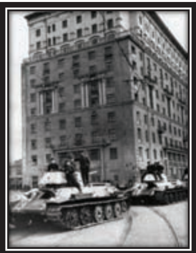
1941. Tanks in the streets of Moscow

In a single capitulation that took place in surroundings of Kiev,