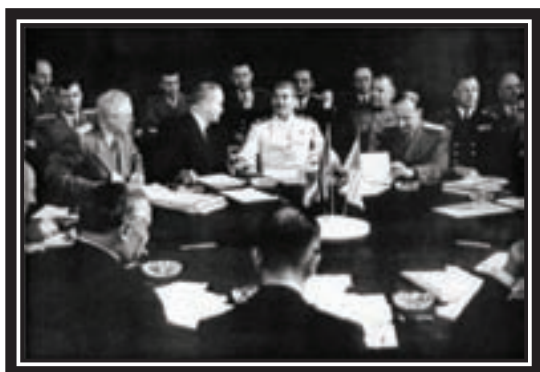
1945г. Сталин В.И., Молотов В.М., Вышинский А.Я. и др. участники советской делегации во время заседания Потсдамской конференции