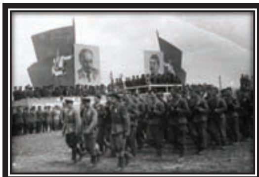
16 июля 1944г. Партизанский парад, посвященный освобождению Минска от немецко-фашистских захватчиков

Характерной особенностью боевых действий Красной Армии в 1944 г. было то, что уже не