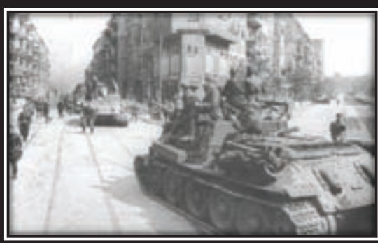
February 8, 1945. 1 st Ukrainian Front. Soviet self-propelled weaponry enters Chenstokhov

During the last international war conference held in Yalta, Roosevelt and Churchill met with Stalin and agreed on the next phase of the war. Believing Germany would collapse around July 1, they