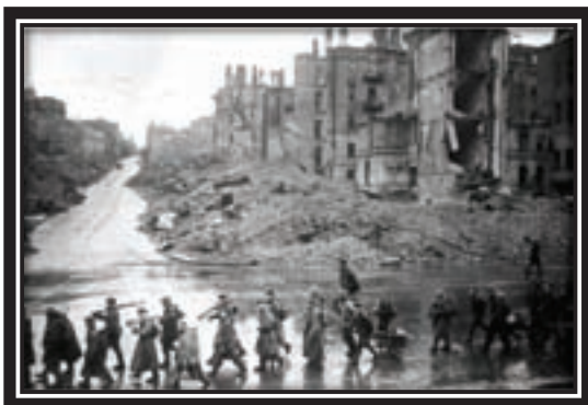
Ноябрь 1943г. Вид Крещатика в Киеве после ухода фашистов из

за победу над агрессором, была чрезмерно велика. В развалинах лежали 1710 городов нашей страны, свыше 70 тыс. сел и деревень были сожжены. За-