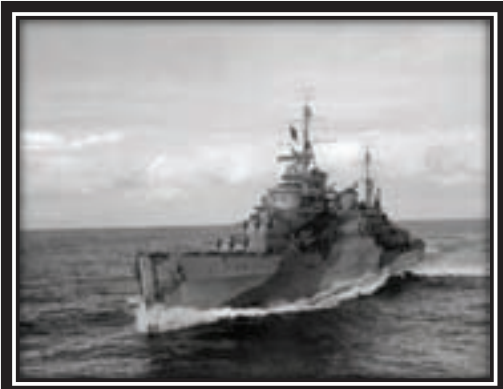
1942. Anglo-American vessels in the Murmansk port

The Russians launched a major offensive attack