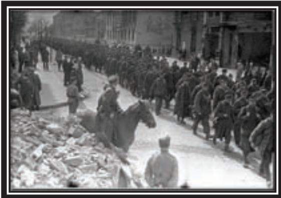
April, 1945. Königsberg. Troops from 3 rd Byelorussian Front escort German prisoners of war

Russian forces under Zhukov, and Marshal Ivan Konev, launched their greatest offensive attack of the war from Poland and Eastern Prussia. A total of 1,350,000 Russians attacked the German Army,