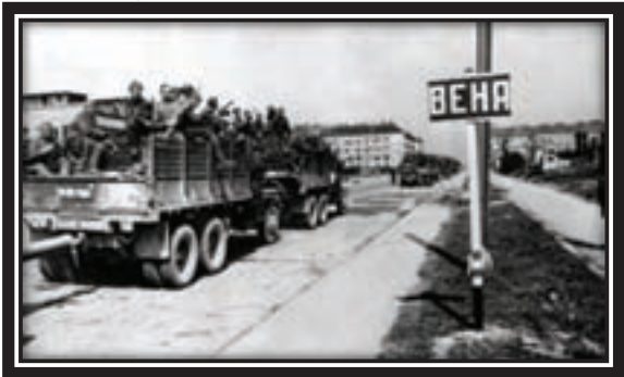
1945. Soviet troops entering Vienna

US 2 nd and 5 th Armored Divisions reached the Elbe at Wittenberg, Webern and Sandau.