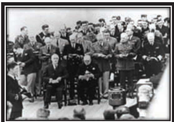
23 августа 1941г. Встреча Рузвельта Ф. и Черчиля У. на линкоре «Принц Уэльский». Главы государств и члены делегаций во время общей молитвы, предшествовавшей политическим переговорам