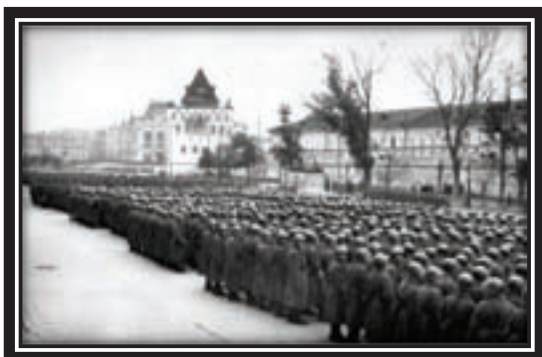
1941. Отправка на фронт воинских частей, г. Горький

22 июня на базе приграничных военных округов были образованы фронты: Северо-Западный (командующий ген. Ф.И. Кузнецов), Западный (командующий ген. Д.Г.Павлов) и Юго-Западный (командующий ген. М.П. Кирпонос). 24 июня появился новый фронт — Северный (командующий ген. М.М. Попов). За день до этого учреждается Ставка Главного Командования (с августа — Ставка Верховного Главнокомандования), 30 июня — Государственный Комитет Обо-