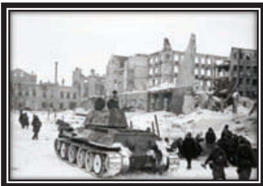
Февраль 1943 г. Танки Н-ской бригады входят в город Сталинград с победоносным флагом

1942г., и через пять дней передовые части Юго-Западного и Сталинградского фронтов сомкнулись, окружив более 330 тыс. немецких солдат и