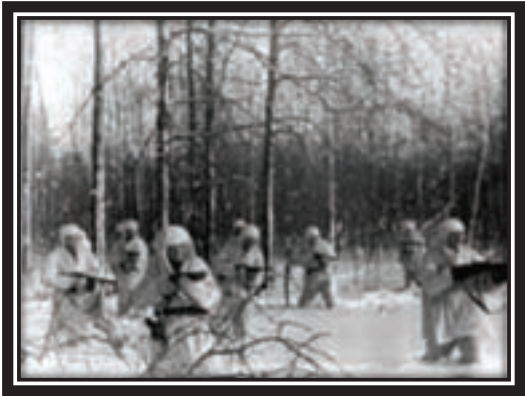
1941. Mortar men-paratroopers on their firing positions near Moscow

Russia suffered another military disaster as the