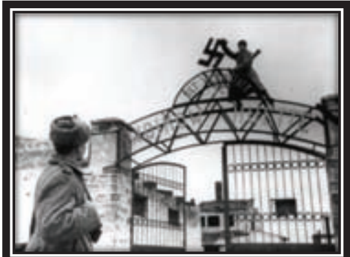
April, 1944. Soviet troops removing swastika from the entrance gate to Voikov plant in liberated Kerch

Stalin was told the date of the Normandy invasion. Almost simultaneously, the Japanese told the Soviet Union that they were willing to mediate a peace between Germany and Russia. The initiative was Tokyo's not Berlin's and the Russian rejected the offer.