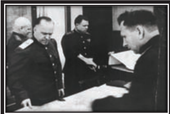
April, 1945. Landenberg, Germany. Development of Berlin Operation. From left to right: Telegin K., Zhukov G., Malinin M., Varennikov I.

All resistance in the Ruhr pocket ended with the surrender of 325,000 German troops under the