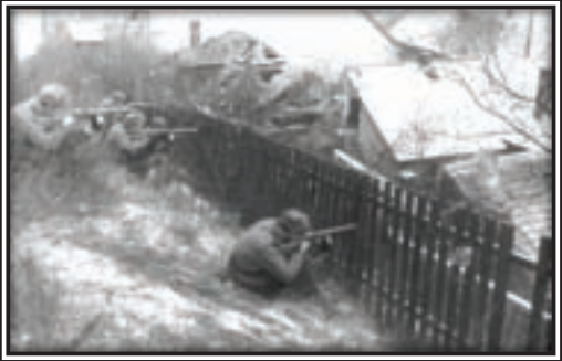
January 8, 1945. Hungary. Sub-machine gunners of the 3 rd Ukrainian Front fighting on the streets of Budapest

cle. Hitler refused Central's Army group request to withdraw from Warsaw area. Russian forces captured Radom in Poland. Hitler relocated his headquarters to Eastern Prussia, to the bunker under the Reich Chancellery in Berlin. There he spent the remainder of his life. Hitler pulled the Sixth Panzer Army from the Western Front and sent it to Hungary.