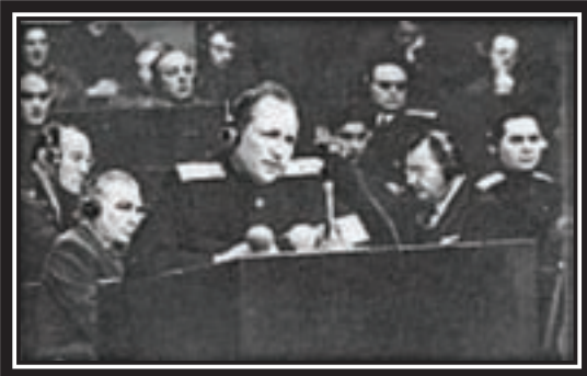
1945. Rudenko R. the major speaker on behalf of prosecution on the stand at the Nuremberg Trial

For the Soviet people the conflict lasted 1,418