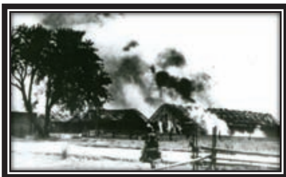
Июнь 1941 г. Белорусская ССР

Несколько позже было принято решение о подготовке третьего рубежа стратегического значения, способного обеспечить войскам возможность