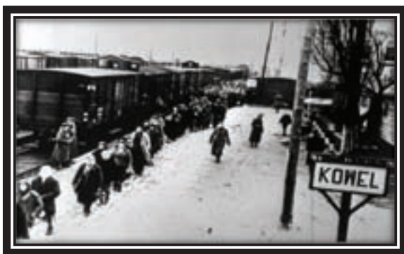
1942г. УССР. Советские граждане под охраной немецких солдат на станции Ковель перед отправкой в Германию

В сентябре 1942 г. Генштаб, руководимый А.М. Василевским, и заместитель Верховного Главнокомандующего Г.К. Жуков приступили к разработке наступательной операции под Сталинградом, где в кровопролитных уличных боях